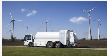
2. Workshop (09.07.2020) Conversion of heavy trucks to H 2 (196 participants/341 unique views) Faun Gruppe