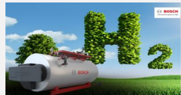
4. Workshop (06.08.2020) Industrial heat by H 2 boiler. (201 participants/454 unique views) Bosch A.G.