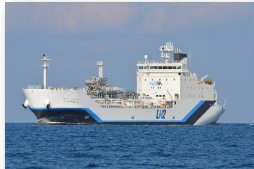
Buque SUIISO FRONTIER